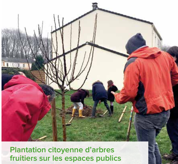
Plantation citoyenne d'arbres fruitiers sur les espaces publics

La transition écologique vise à l'autonomie locale dans un contexte de dépendance aux énergies fossiles, de réchauffement climatique avec la nécessité de réduire les émissions de CO 2 .