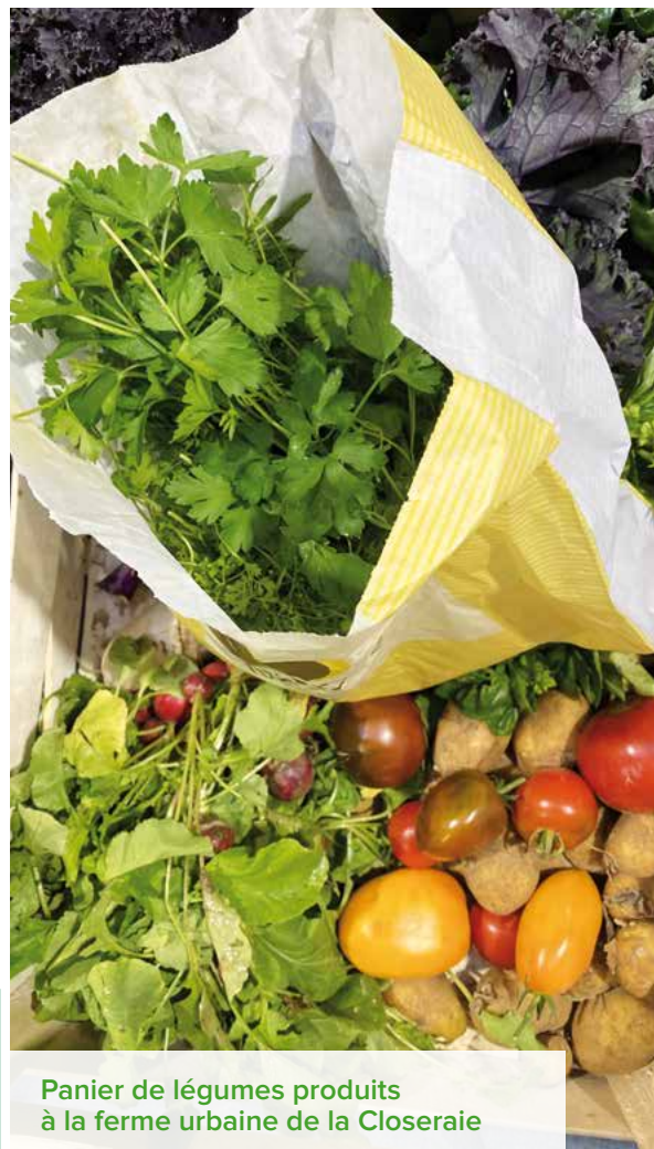
Panier de légumes produits à la ferme urbaine de la Closeraie