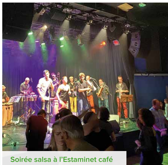
Soirée salsa à l'Estaminet café