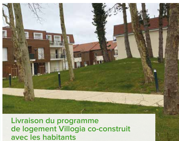
Livraison du programme de logement Villogia co-construit avec les habitants