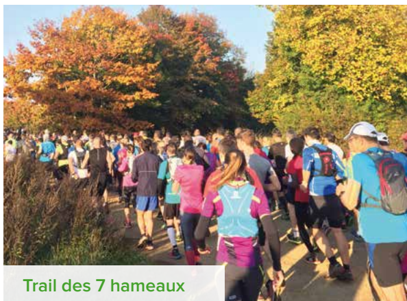
Trail des 7 hameaux