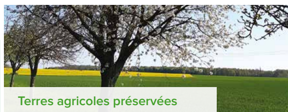
Terres agricoles préservées